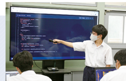
プログラミングの内容をプレゼンしています。

部の特徴としては、各部員が1グループ4～5人で4つのグループに分かれています。まず1つ目は動画などを制作・編集するグループ、2つ目は音楽を制作するグループ、3つ目はプログラミングをするグループ、最後はゲームを制作