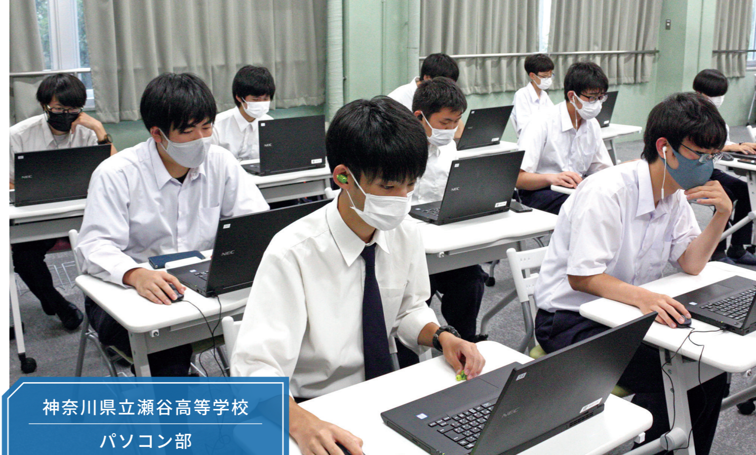
神奈川県立瀬谷高等学校 パソコン部

自主的に活動することができる部員達なので、部としてその環境を整えていきたいと思っています。