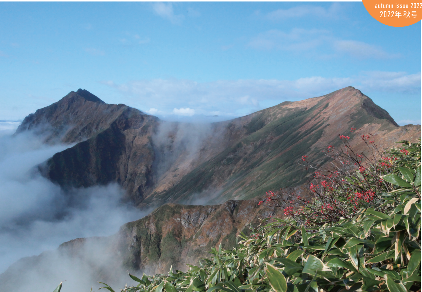
「中央アルプス」 撮影 学院長