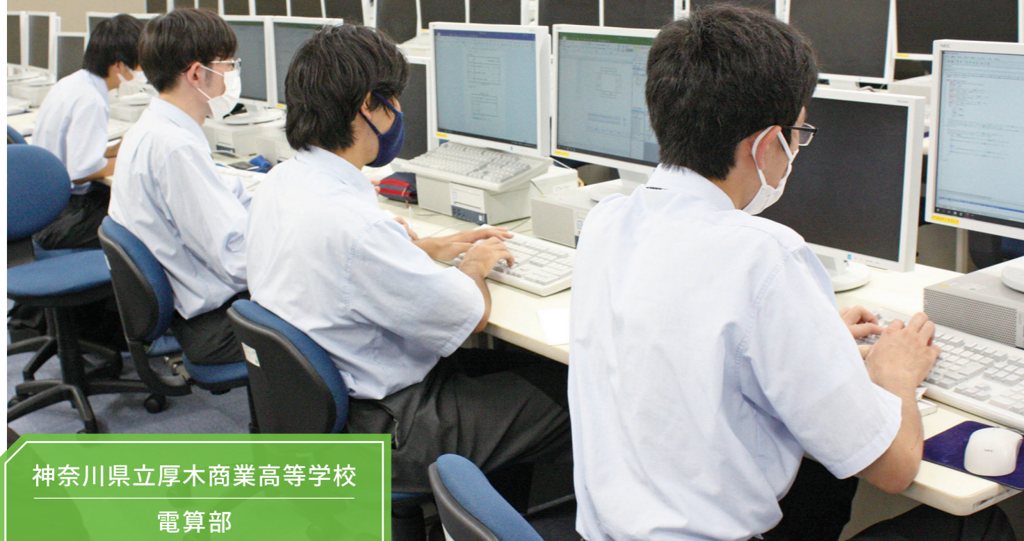
神奈川県立厚木商業高等学校 電算部