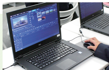
撮影した動画を編集しています。

今年度のメインの活動は、校長先生からの依頼で、5分～10分の学校紹介動画の制作です。この動画の完成目標は、来年3月を見込んでいて、そのための作業を日々行っています。具体的には、ひとりひとりが好きなシーンを選び、撮影から音入れまでの編集作業をしています。(例えば、生徒が通学する通学路のシーンや、校舎内を案内しながら教室を撮影したりしています。)部員の中には、パソコン初心者も多く在籍していて、入部したきっかけもパソコンをもっと勉強したいという理由がほとんどです。そのため、一からタイピングを学んでいる部員もいます。また昨年は、マイク