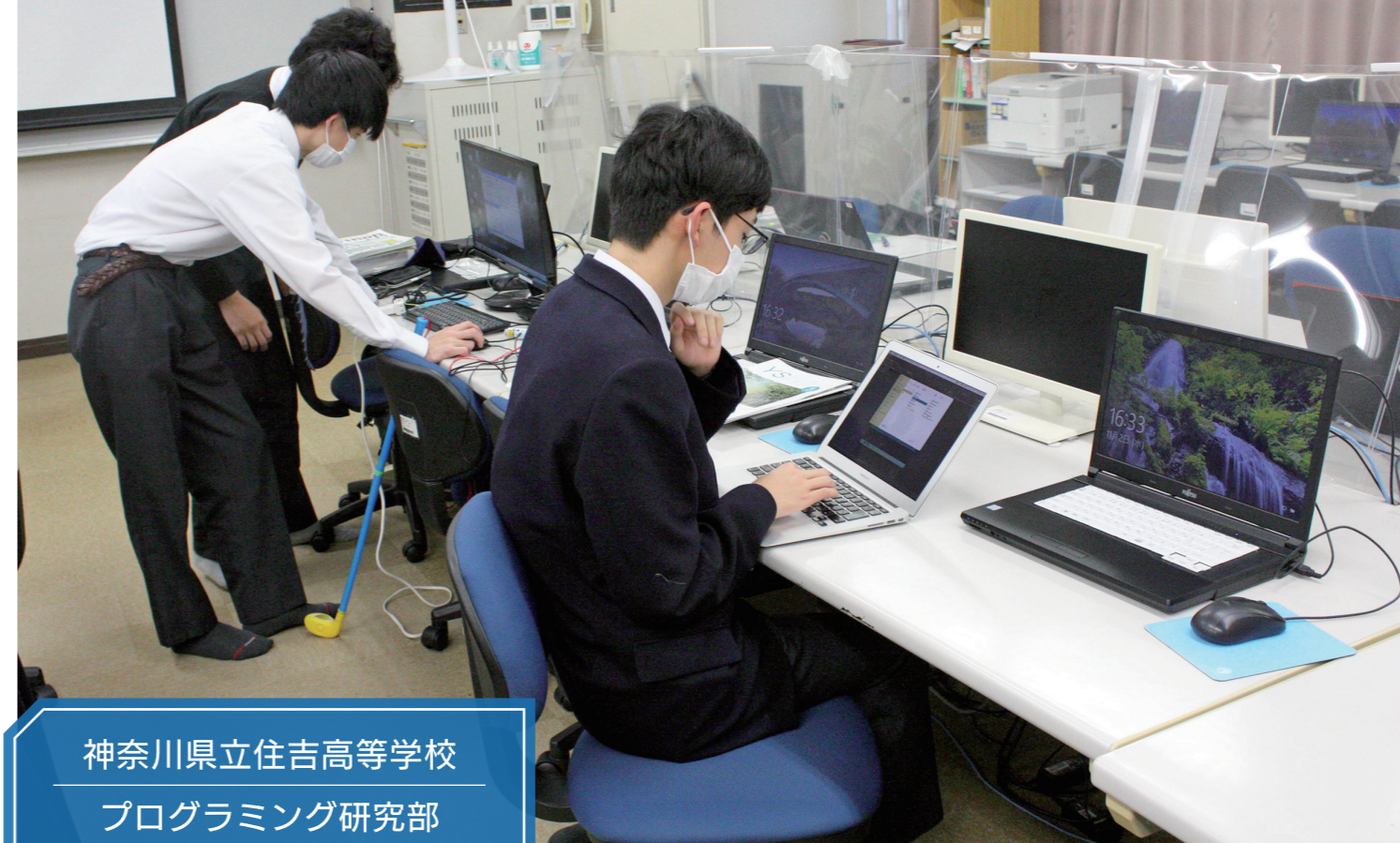
神奈川県立住吉高等学校 プログラミング研究部