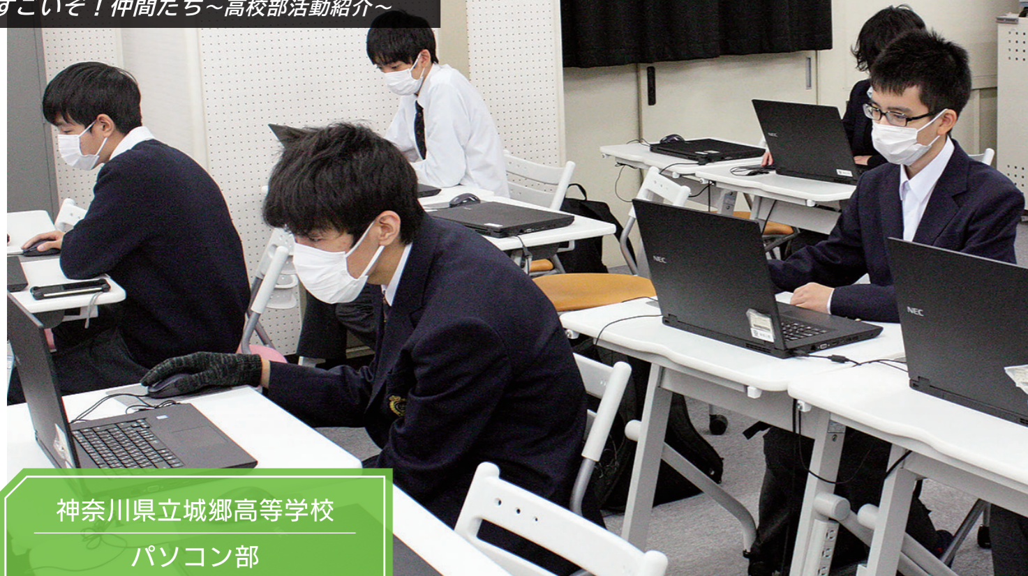
神奈川県立城郷高等学校 パソコン部