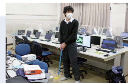
実際にシミュレーションをしています。

プログラミング研究部は、コロナ渦の影響もあり、思うように活動できないこともありましたが、昨年は、科学の甲子園神奈川県大会に出場しました。大会では、プログラミングというよりは、工作のようなことをしました。今年度は、プログラミング研究部という名前の通り、プログラミングの勉強を兼ねた活動をしています。具体的な活動内容は、文化祭に向けての作品制作です。部員それぞれが、プログラミングを使った簡単な作品を制作しました。例えば、プログラミング言語を打ち込んで、オセロやブロックくずしのような簡単なゲームを作った他、昨年度の工作の経験を活かして、おもちゃのゴルフクラブにセンサーを取り付け、クラブを振ってプレイができるシミュレーションゴルフゲームを