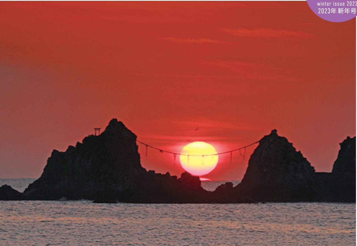
「真鶴半島 三ツ石」