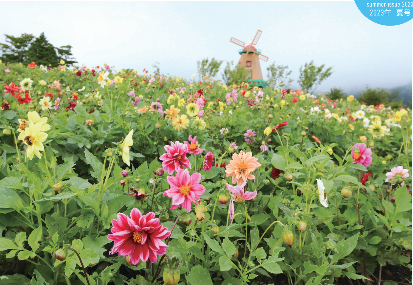
「富士ぐりんぱ」