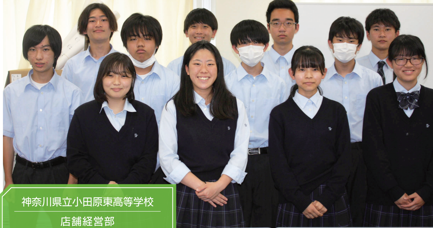
神奈川県立小田原東高等学校 店舗経営部