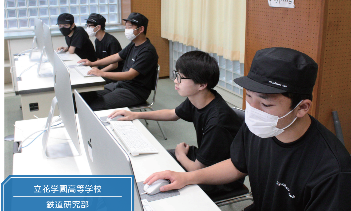
立花学園高等学校 鉄道研究部

自分で発想する力、自分から考える力をつけて、多くの人と協力してほしいです。また、今年は男子の部員も多く入部したので、新しいアイデアも期待しています。