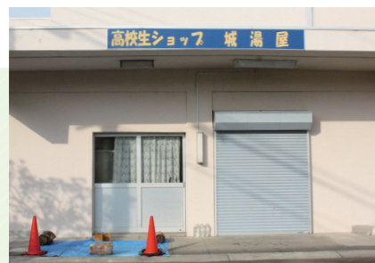
コロナ禍のため、実店舗は閉店しています。

昨年度までは新型コロナの影響で、校外での活動ができていませんでしたが、5月には、eスポーツ大会を校内で開催し、焼きそばなどを販売しました。昨年12月の小田原ピックでは、スポーツの祭典で飲食ブースを担当し、会場となる校庭にクレープやピザなど4台のキッチンカーを手配しました。当時は、ウクライナ侵攻もあり、平和を願う祭典として開催し、大成功を収めたとのこと。毎年行われる秋の文化祭では、地元のパン屋