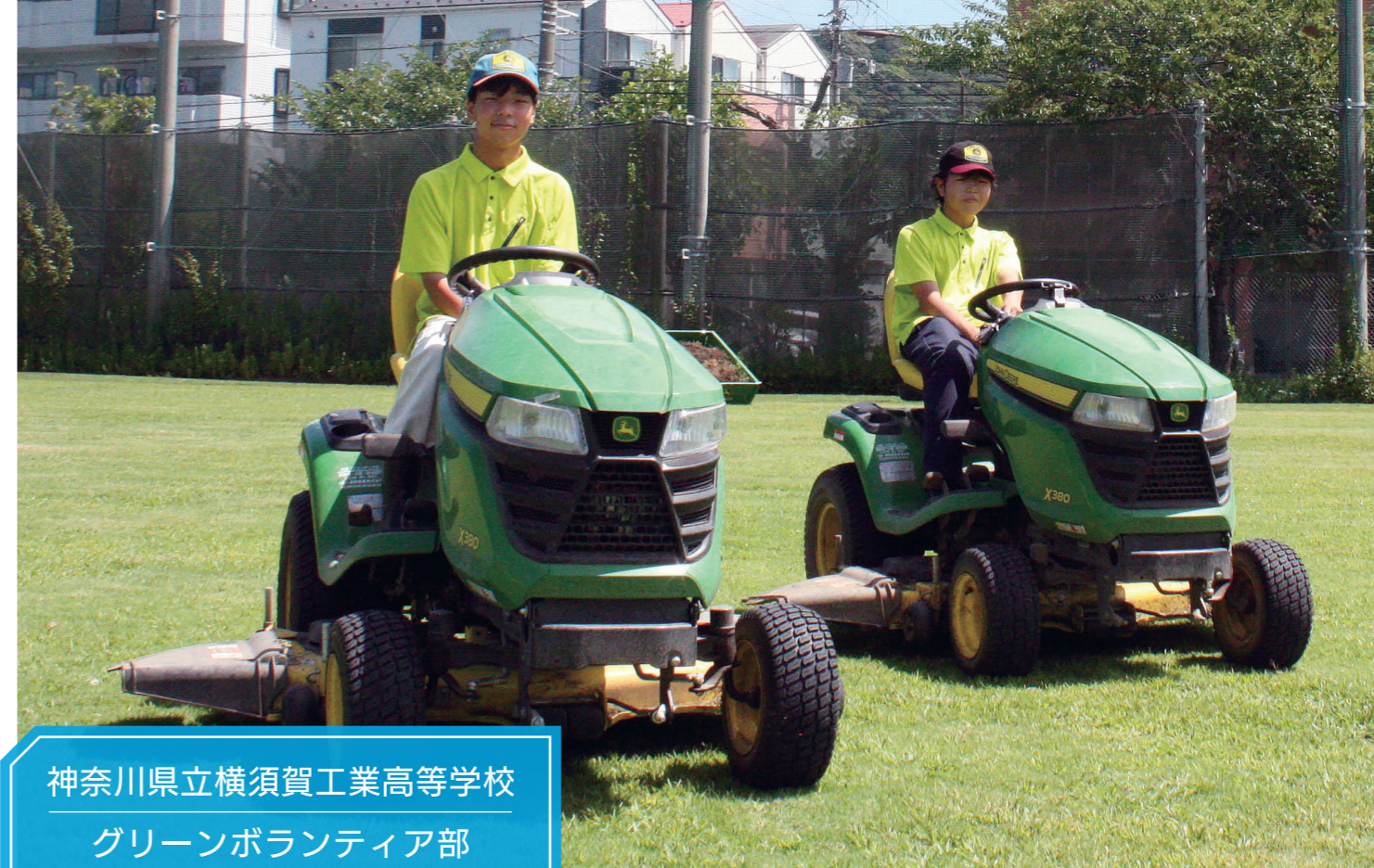
神奈川県立横須賀工業高等学校 グリーンボランティア部

日頃から一生懸命作品に向き合い、しっかり完成させることの積み重ねが結果に繋がっていると思います。美術部として実力が発揮できる土台をしっかり作り上げていければと思います。