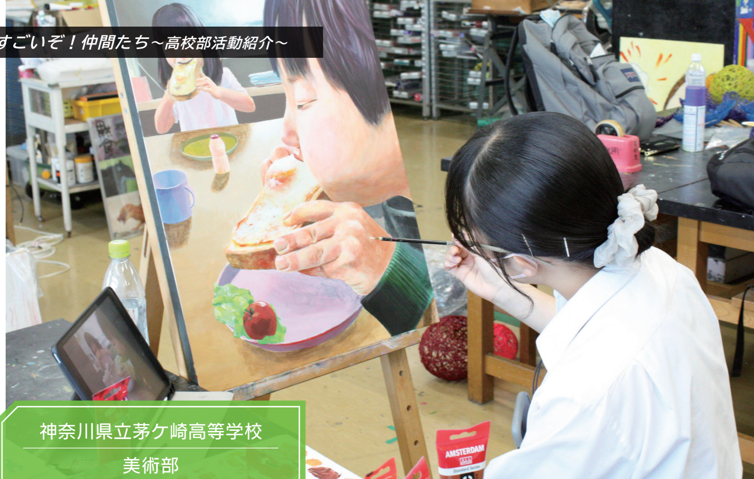
神奈川県立茅ヶ崎高等学校 美術部