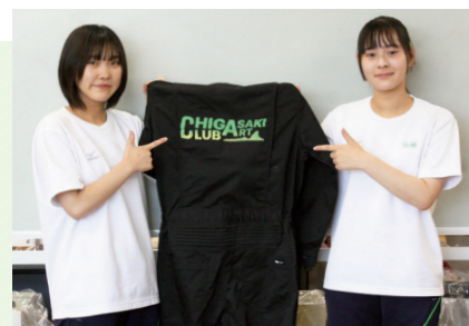
美術部オリジナルのロゴ入りの作業着です！

主な活動は、季節ごとに開催される各種展覧会やコンクールに出品するための作品制作をしています。部員は絵画(油絵・アクリル画・デッサン)や工芸(七宝焼き・革工芸)映像(アニメーション)など、自分の表現したいものを制作