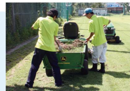
補修するための土を準備しています。

具体的には校庭の芝を芝刈り機で刈って、芝の長さを調整するほか、ところどころ穴の開いてしまった箇所を、肥料をまいて水やりをするなどして、修復しています。広い場所を作業するので、時間もかかり体力的にも大変な作業となっています。他には、6月に開催される体育祭のためにグラウンドを整備し