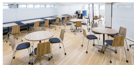
ラーニングコモンズ B1F

通常の授業を行っています。最新のパソコンが並んでいます。放課後などの授業時間外でも使用できます。