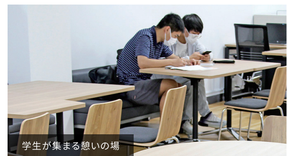
学生が集まる憩いの場