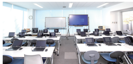
ラボ 2F 3F

エントランスを抜けると多目的ホールがあります。大型モニターが設置されており、説明会などで利用しています。