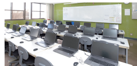
ラボ 1F 2F 3F

通常の授業を行っています。最新のパソコンが並んでいます。放課後などの授業時間外でも使用できます。