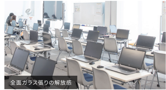
全面ガラス張りの解放感